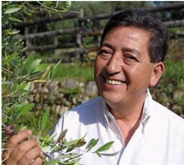
Cheikh Bentounès (Algérie)

Guide spirituel de la Confrérie soufie Alawiyya Écrivain. Président d'honneur d'AISA Internationale Promoteur de la Journée internationale du Vivre ensemble en paix (16 mai)