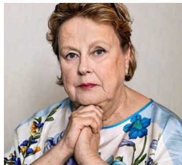
Helena Ranta (Finlande)

Professeur à l'université de Roma Tre Membre de la World History Academy Président de la Communauté Sant' Egidio à Rome