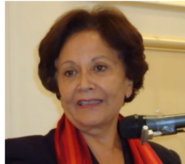
Souhayr Belhassen (Tunisie)

Guide spirituel de la Confrérie soufie Alawiyya Écrivain. Président d'honneur d'AISA Internationale Promoteur de la Journée internationale du Vivre ensemble en paix (16 mai)